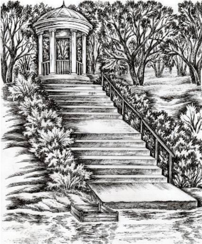
Эскиз Дьякова сада (рисунок Оспицовой Л.А.)

Сочные, ароматные ягоды прячутся под огромными, с красноватым оттенком, листьями.